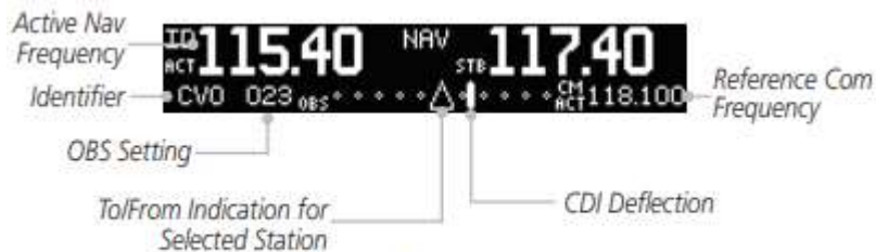
Figure 2-14 CDI Display