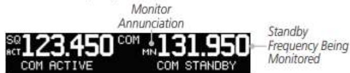
Figure 2-2 Com Frequency Monitor Annunciation